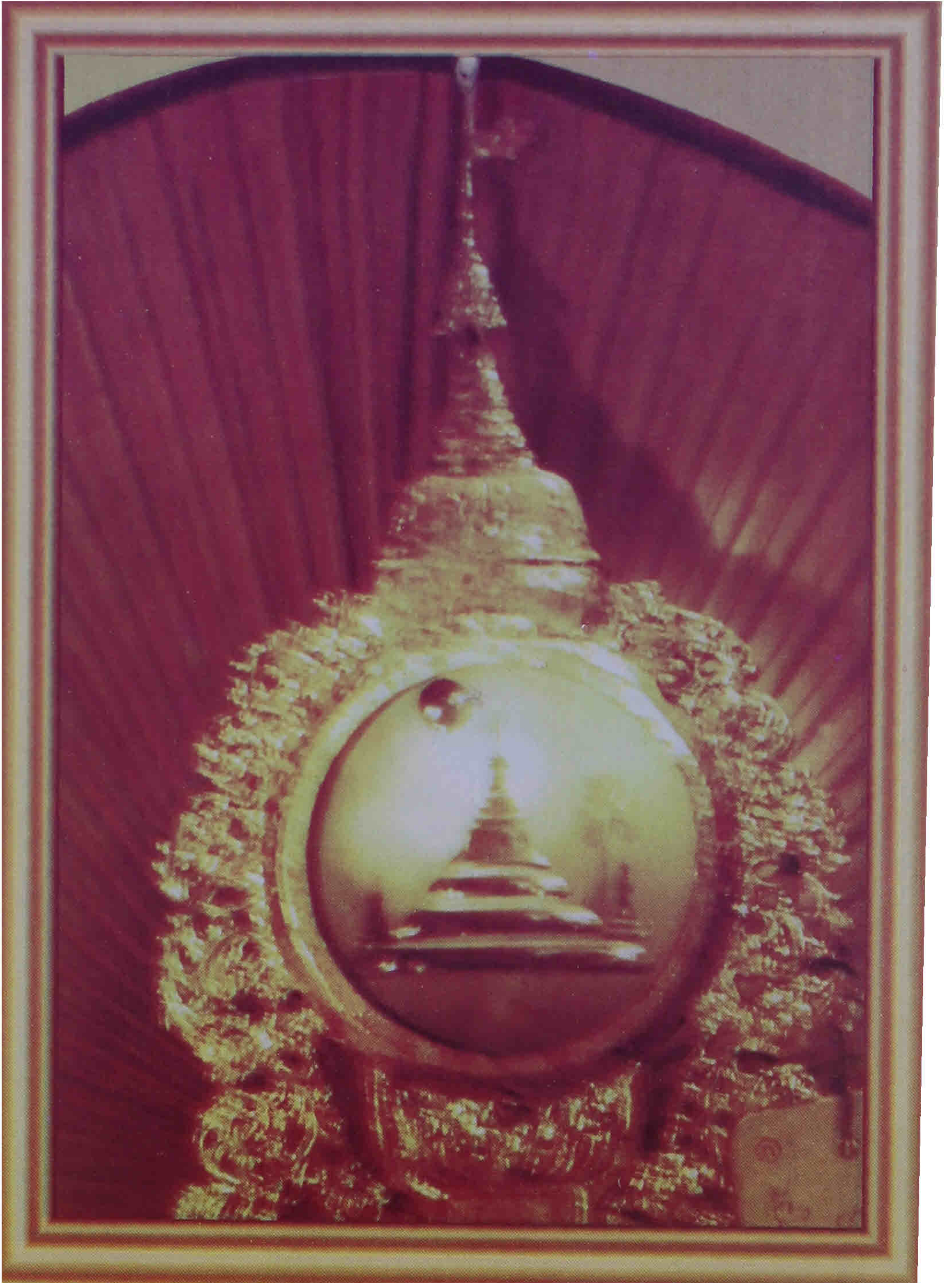
ရောင်ခြည်တော်ကွန့်ဖြူးသည့် ဖြတ်စွာဘုရားရှင်၏ ဓါတ်တော်များ