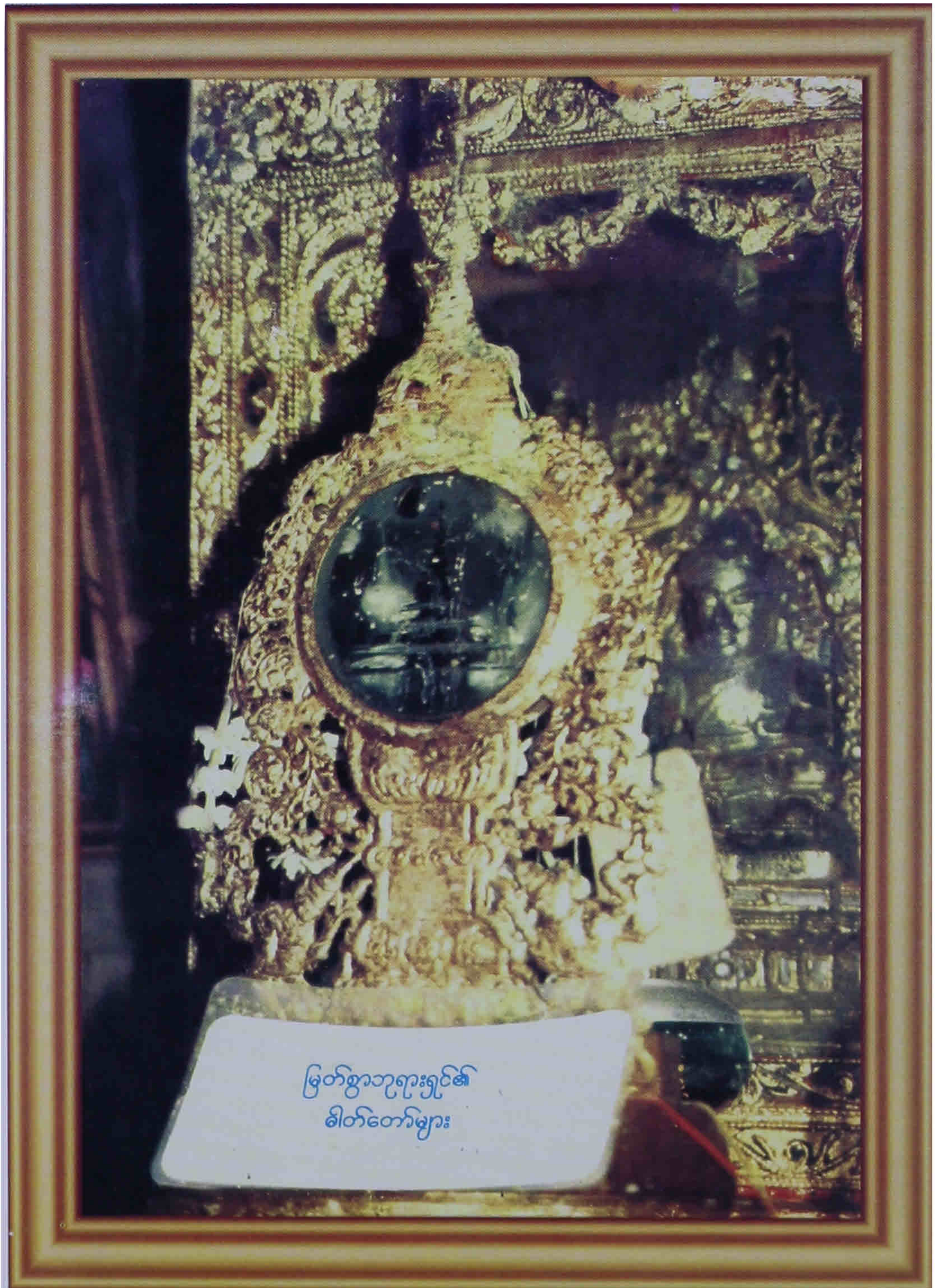
မြတ်စွာဘုရားရှင်၏ ဓါတ်တော်များ

ရောင်ခြည်တော်ကွန့်ဖြူးသည်. မြတ်စွာဘုရားရှင်၏ ဓါတ်တော်များ