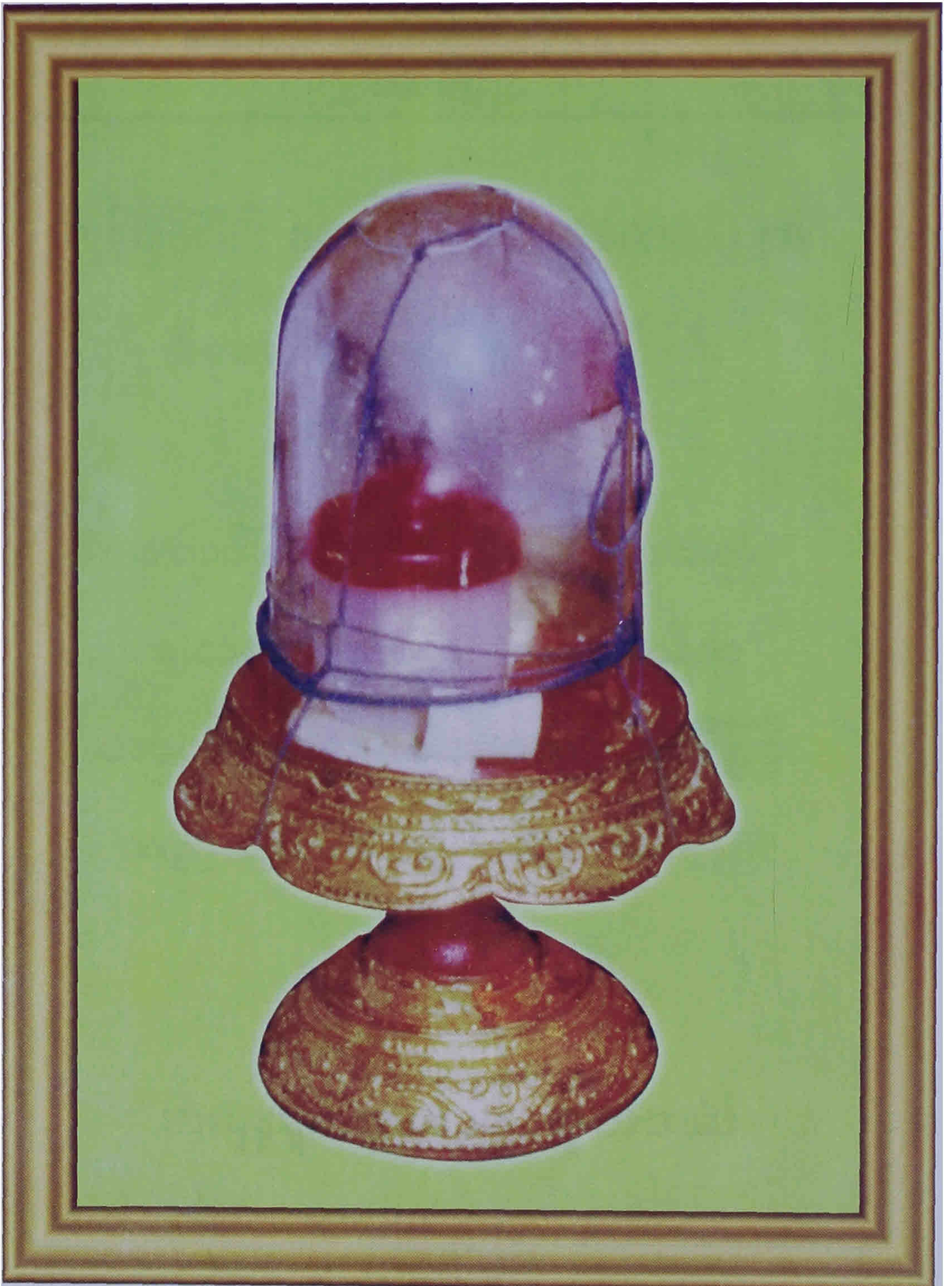
ရောင်ခြည်တော်ကွန့်ဖြူးသည့် ရဟန္တာ၏တော်များ